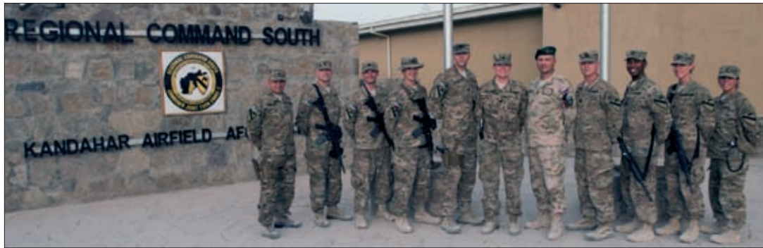
Obrázok 16: Príslušníci veliteľstva RC-S v KAF-e po slávnostnej ceremónii

Mimo príspevkov OS SR vysielaných z územia SR, OS SR umožnili vyslanie do ISAF-u aj príslušníkom OS SR vyslaných na nasaditeľné pozície v štruktúrach NATO. Cieľom bolo umožniť spojeneckým veliteľom splniť požadované úlohy daného veliteľstva a získať pripravený a skúsený personál z pôsobenia v mnohonárodnom prostredí pre ich ďalšie pôsobenie v OS SR. Ich nasadenie bolo realizované v rámci celého Afganistanu na rôznu dobu vyslania.