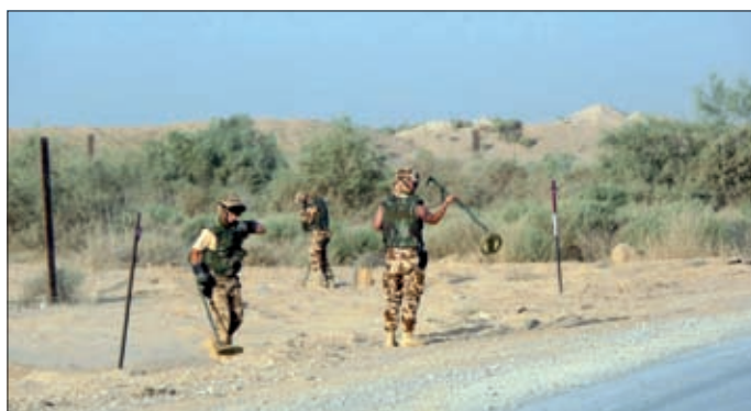
Obrázok 5: Odmínovanie priestoru na letisku KAIA

Hlavnou úlohou ženijnej odmínovacej čaty bolo odmínovanie na plochách a cestných komunikáciách v operačnom priestore ISAF. Ženijná odmínovacia čata sa skladala z odmínovacieho, technického a zdravotníckeho družstva a bola zaradená do tabuliek počtov krízovej časti (Crisis establishment) KAIA.