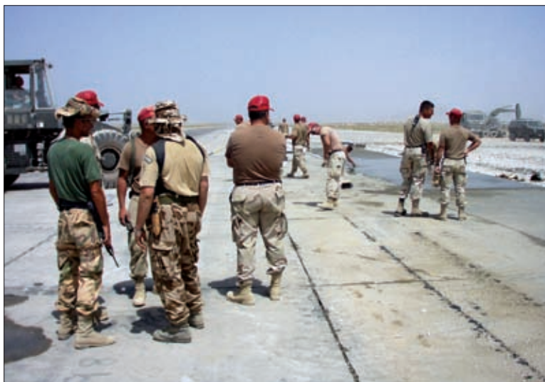
Obrázok 4: Betónovanie vzletovej a pristávacej dráhy

Hlavnou úlohou jednotky bola obnova a údržba letiska Bagram. Na rekonštrukcii vzletovej a pristávacej dráhy a budovaní infraštruktúry letiska (nových spojovacích plôch a stojánok leteckej techniky) sa naši profesionálni vojaci priamo podieľali spolu s príslušníkmi ozbrojených síl USA, Talianska a Thajska.