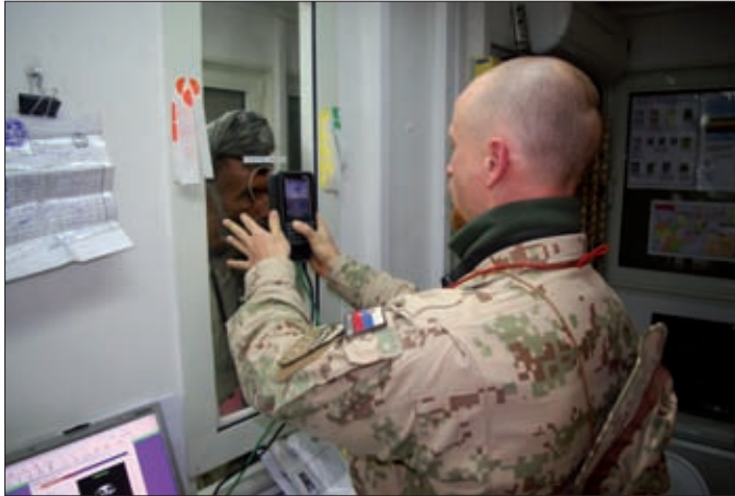
Obrázok 14: Kontrola biometrických údajov miestnemu pracovníkovi pri vstupe do KAF-u cez ECP-5

vojenskej operácie ISAF. V júni 2010 bola SJ KAF posilnená o SJ vyčlenenú pre ECP-5 na celkový počet 118 profesionálnych vojakov OS SR. V septembri 2010 bola SJ KAF doplnená o SJ DR v počte 47 profesionálnych vojakov a zlúčením vstupno-výstupných brán ECP-3 a ECP-5 dosiahla celkový počet 165 profesionálnych vojakov OS SR. Dňa 17. septembra 2010 zostala ECP-3 otvorená iba pre vstup koalíčných síl.