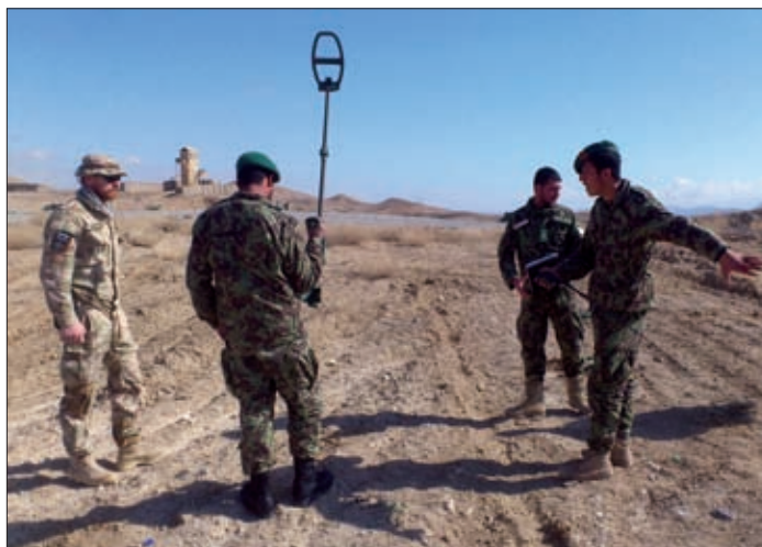
Obrázok 21: Výcvik vojakov Afganskej národnej armády s mínohľadačkami na základni FOB Langman

Hlavnou úlohou jednotky MSF SFAT bolo vykonávanie asistencie pre manévrový prápor rýchlej reakcie ANA 4/2 MSF KDK v provinciách Kandahár a Zábúl so schopnosťou nasadenia na celom území Afganistanu. Príslušníci jednotky boli určení za poradcov, plnili široké spektrum úloh podpory, mentoringu a poradenstva 4/2 MSF KDK. Koordinovali aj aktivity medzi 4/2 MSF KDK a jemu nadriadenou 2. MSF brigádou ANA a koordináciu s odborným nadriadeným 2. MSF BDE SFAT (US partner) a s nadriadeným zabezpečujúcim podporu (v provincii Kandahár TF 1-12 Red Warrior). Príslušníci FP plnili úlohy ochrany poradcov počas presunov a poradenstva. Príslušníci TOC-u plnili úlohy podpory, prijímania, analýzy a odovzdávania informácií medzi nadriadeným a podriadeným stupňom počas pôsobenia príslušníkov jednotky mimo objektu základne KAF a zároveň sa spolupodieľali na výcviku 4/2 MSF KDK v oblasti palebnej podpory.