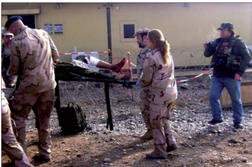
Obrázok 11: Poskytnutie zdravotnej starostlivosti miestnemu obyvateľovi

V júli 2009 vycestovali na takmer päť mesiacov do Afganistanu ďalší traja slovenskí vojenský zdravotníci. Lekár a dvaja zdravotnícki špecialisti plnili úlohy na stupni zdravotníckeho zabezpečenia ROLE 1 čo znamenalo, že k ich najhlavnejším činnostiam patrila neodkladná a rozšírená lekárska prvá pomoc (ošetrenie po úrazoch, popáleninách, dopravných nehodách), triedenie ranených a chorých a starostlivosť v oblasti všeobecného lekárstva.