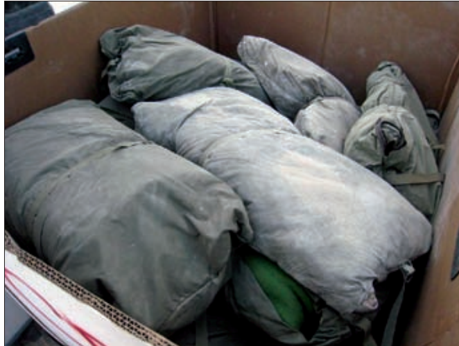
Obrázok 24: Humanitárna pomoc Slovenska pre Afganistan

Slovenskí vojaci doposiaľ participovali na viac ako dvoch desiatkach operácií jednotlivých organizácií medzinárodného krízového manažmentu. Z vojenského hľadiska bola najvýznamnejšou participácia na vojenskej operácii ISAF v Afganistane. Pôsobenie príslušníkov OS SR v nej bolo pozitívne hodnotené nielen spojencami, ale aj vládou Afganskej islamskej republiky. Slovenskí vojaci v nej získali mnoho skúseností a zručností, vďaka ktorým si prehĺbili svoje odborné spôsobilosti.