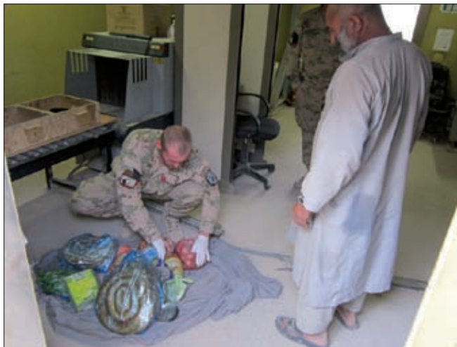
Obrázok 13: Kontrola batožiny miestnemu pracovníkovi pri vstupe na základňu Holland

NR SR svojim uznesením č. 901 z 19. júna 2008 písomne potvrdila aj vyslanie strážnej jednotky v počte 50 príslušníkov OS SR v mesiaci september 2008 s požadovanou výzbrojou a výstrojom bez technickej podpory na zabezpečenie stráženia tábora „Camp Holland“, vo vnútornom perimetri základne FOB Ripley v Tarin Kowt-e (TK) v provincii Uruzgan. Medzi jej hlavné úlohy patrilo stráženie, dozorná služba a patrolovanie vnútorného perimetra základne statickým spôsobom. 12) Strážna služba zahrňovala priamu ochranu a obranu objektov s výzbrojou, bojovou technikou a muníciou, patrolovanie vo dne i v noci a za každých poveternostných podmienok a vo vykonávaní fyzickej kontroly osôb a techniky pri vstupe do strážených objektov. 13)