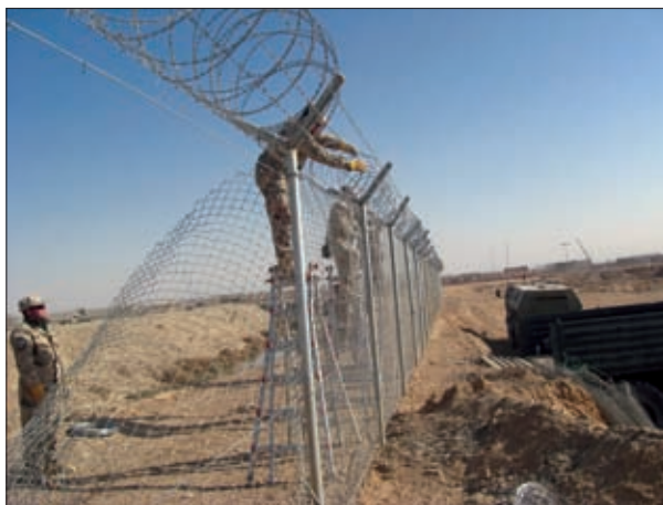
Obrázok 6: Budovanie oplotenia na perimetri letiska KAF

Od začiatku pôsobenia v operácii (zahŕňajúc aj ženijnú odmínovaciu čatu) v roku 2004 bolo ručným spôsobom odmínovaných viac ako 800 000 m 2 a mechanickým spôsobom pomocou odmínovacích zariadení 1 232 500 m 2 . Celkovo bolo nájdených a zničených 3 818 ks munície, ako napr. protipechotné míny, rakety, nevybuchnutá a kontajnerová munícia.