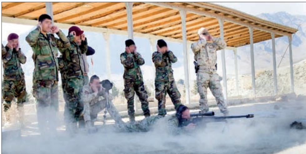
Obrázok 20: Výcvik ostreľovačov Afganskej jednotky

ré uplatňovalo OPCON. Úlohou koalície jednotky SOAG, pod ktorú SVK SOAG patrila, bol rozvoj spôsobilostí veliteľstva divízie a jeho podriadených jednotiek (ANA Special Operations Command – ďalej len „ANASOC“) vo všetkých spôsobilostiach SOF, t. j. v horizontálnom (G1 až G6) a vertikálnom (strategicko-operačná, taktická úroveň) rozpätí. Zahŕňala taktiež poradenstvo a mentoring.