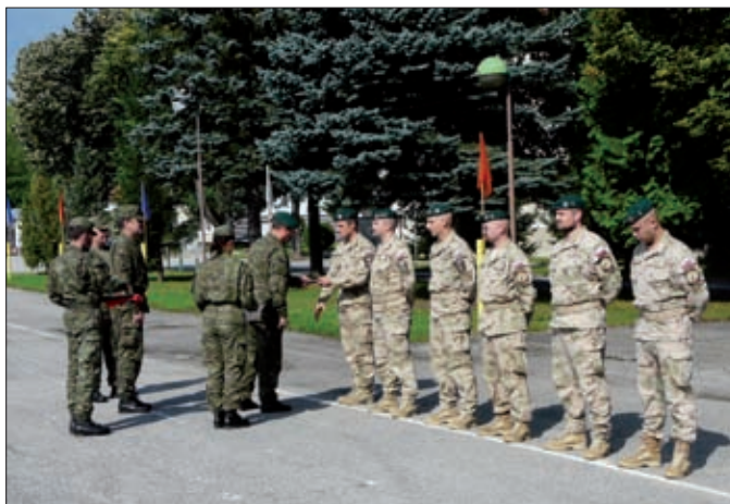
Obrázok 22: Slávnostné privítanie príslušníkov DCM-C vracajúcich sa z operácie ISAF

Na základe požiadavky veliteľa 3. spojovacieho práporu skupiny NATO pre KIS bol uznesením NR SR č. 1064 z 19. marca 2014 vyslaný v apríli 2014 ďalší príspevok DCM-C v počte do šesť profesionálnych vojakov ako príspevok k naplneniu jednej z kľúčových nedostatkových spôsobilostí NATO. V dvoch rotáciách sa vystriedalo celkovo päť profesionálnych vojakov. Hlavné úlohy jednotky DCM-C boli spojené s poskytovaním podpory služieb KIS, ako aj podpory rádiových systémov v rámci veliteľstva špeciálnych síl v Kábule.