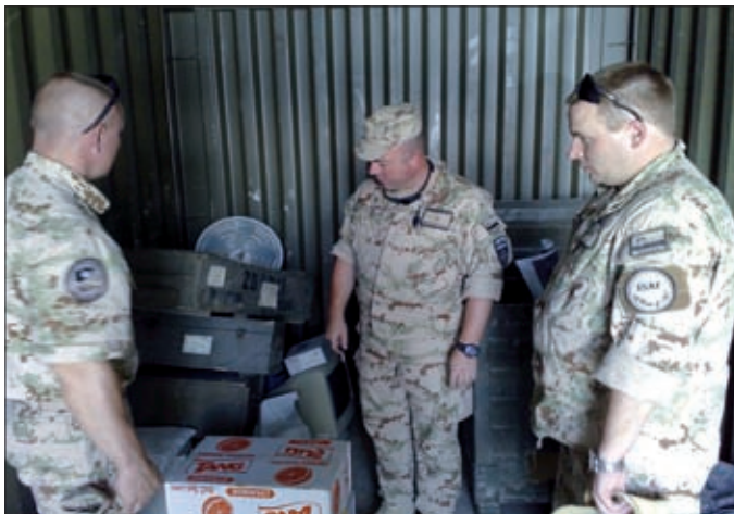
Obrázok 15: Kontrola logistického skladu zástupcom veliteľa SLOVCON-u, (Foto: mjr. Peter Pavlovský)

Hlavnými úlohami NSE boli koordinácia národnej logistickej podpory, plnenie úloh finančno-ekonomického zabezpečenia, koordinácia strategických a operačných preprav, psychologická služba, pastoračná činnosť a podpora KIS. Spravodajská podpora činnosti kontingentu OS SR v operácii ISAF bola zabezpečená pracovníkom VOS a policajná podpora činnosti kontingentu OS SR bola zabezpečená pracovníkmi VP.