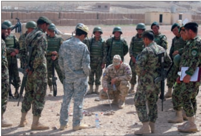
Obrázok 8: Výcvik vojakov Afganskej národnej armády pri plánovaní a vykonávaní konvojov

Obsahom školení boli základné zručnosti, návyky, taktika, zdravotnícka pomoc, či výstavba bezpečnostných štruktúr.