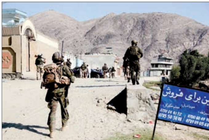
Obrázok 19: Priama akcia, operácia typu Cordon and Search

né územie. Ukončenie pôsobenia SOTU súviselo s potrebou vybudovania, výcviku a prípravy plánovaného nasadenia jednotky účelového zoskupenia pre špeciálne operácie (Special Operation Task Group – ďalej len „SOTG“), ktorá mala byť do operácie ISAF vyslaná v roku 2014.