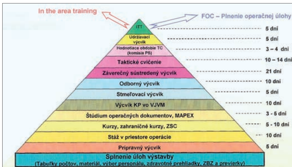
Obrázok 3: Model prípravy nasadzovaných jednotiek v operácii ISAF v zodpovednosti Pozemných síl OS SR v rokoch 2009 – 2014

Nasadzované jednotky boli do operácie ISAF pripravované postupne podľa organizačných nariadení a rozkazov veliteľov zodpovedných za prípravu jednotlivých príspevkov (Operačný rozkaz – ďalej len „OPORD“, Administratívny rozkaz, Varovný rozkaz, Čiastkový rozkaz). Tieto vychádzali z operačných plánov (ďalej len „OPLAN“) náčelníka Generálneho štábu OS SR. Organizácia výcviku spravidla zodpovedala schéme znázornenej na obrázku 3. Špecifiká prípravy jednotiek nasadzovaných do operácie ISAF záviseli od typu a poslania príspevku.