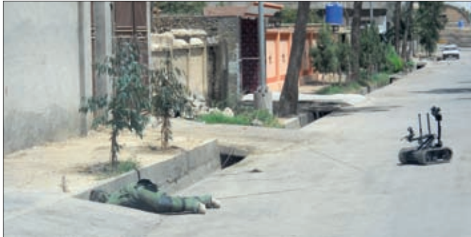
Obrázok 17: Príslušník EOD tímu pri zneškodnení IED

Medzi úlohy EOD tímu patrila tiež detekcia, identifikácia, vyhodnocovanie situácie a možných hrozieb na mieste, neutralizácia, zaistenie, vyslobodenie a finálna likvidácia nevybuchnutých výbušných prostriedkov výbušnou a nevybušnou cestou. Tím vykonával aj zber a vyhodnocovanie forenzného dôkazového materiálu pre potreby povýbuchového vyšetrovania, čím prispieval k EOD spravodajskej činnosti. Zároveň vykonával aj patrolovanie na vytypovaných úsekoch ciest a bol jednou z jednotiek, ktoré boli zaradené do pohotovosti v prípade nahlásenia EOD incidentu. Priestor pôsobenia bol vymedzený na región juh, ktorý zahŕňal aj operačný priestor RC Juhozápad (RC-SW) a operačný priestor RC Juhovýchod (RC-SE).