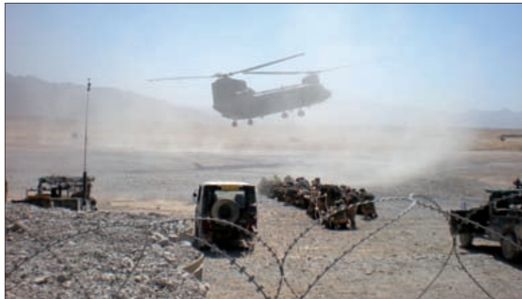
Obrázok 12: Zabezpečenie pristávacej plochy na vonkajšom perimetri na základni Hadrian

Hlavnou úlohu SJ bol výkon strážnej služby na základni Hadrian, priama ochrana a obrana objektov s výzbrojou, bojovou technikou a muníciou, patrolovanie vo dne i v noci a za všetkých poveternostných podmienok a vo vykonávaní fyzickej kontroly osôb a techniky pri vstupe do strážených objektov. 11) Ďalšou úlohou bolo zabezpečenie a ochrana vrtuľníkovej pristávacej plochy.