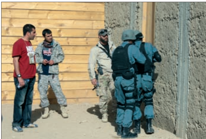
Obrázok 18: Výcvik Afganskej národnej polície v taktickej príprave

NR SR svojim uznesením č. 117/2012 z 24. júla 2012 písomne potvrdila vyslanie v počte do štyroch príslušníkov vojenskej polície na plnenie úloh výcviku afganskej národnej polície (Afghan National Police – ďalej len „ANP“) za účelom zapojenia sa do úsilia o zvýšenie bezpečnosti v krajine a posilnenia ANSF dlhodobou udržiavať stabilitu. Dvaja príslušníci vojenskej polície plnili úlohy v rámci Výcvikovej misie NATO (NATO Training Mission-Afganistan – ďalej len „NTM-A“) a boli zaradení do 4. výcvikovej jednotky Vojenskej polície Wardak (ďalej len „VJVP“), ktorá pôsobila v afganskom Národnom policajnom výcvikovom centre (National Police Training Center – ďalej len „NPTC“) v provincii Wardak. Hlavnou úlohou jednotky bol mentoring afganských inštruktorov výcviku a príslušníkov štábu NPTC, ktorí sa spoločne podieľali na príprave afganských policajných zložiek. Medzi jednotlivé oblasti mentoringu patrili témy ako napr. policajná taktika, strelecká príprava, afganský právny systém, výučba v oblasti ľudských práv, protipovstalecký boj, boj proti terorizmu, potláčanie davu a demonštrácií, zdravotná príprava a spojovacia príprava. Za dobu pôsobenia 4. VJVP bolo vykonaných 14 kurzov rôznych zložiek afganskej polície. Do ukončenia pôsobenia 4. VJVP prešlo základným výcvikom 4 909 študentov, z toho bolo vyradených 1 879 študentov.