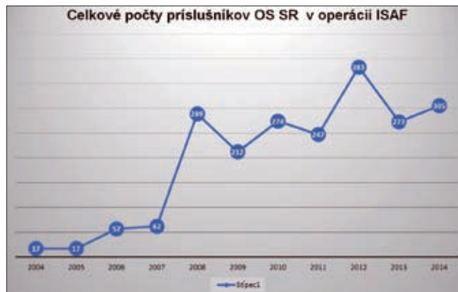
Obrázok 23: Celkové počty príslušníkov OS SR v operácii ISAF

zapojilo celkovo 51 krajín, z toho 28 členských štátov NATO. Na jej vrchole v roku 2010 bolo v Afganistane nasadených približne 140 000 vojakov. Počas trvania operácie ISAF vrátane operácie OEF zahynulo 3 485 koalíčných vojakov, z toho 2 356 z USA. 18)