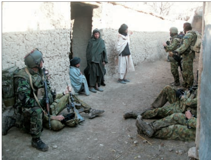
Obrázok 7: Príslušník PRT počas komunikácie s predstaviteľmi miestnej komunity

Z dôvodu realizácie rozhodnutia afganskej vlády o prevzatí základne Tarin Kowt príslušníkmi afganskej národnej armády (Afghan National Army – ANA), naplneniu poslania PRT a odovzdania plnenia úloh orgánom vlády Afganistanu, bolo v súlade s uznesením NR SR č. 728 z 3. septembra 2013 ukončené pôsobenie príslušníkov PRT v operácii ISAF a príslušníci OS SR boli stiahnutí na vlastné územie v júni 2013.