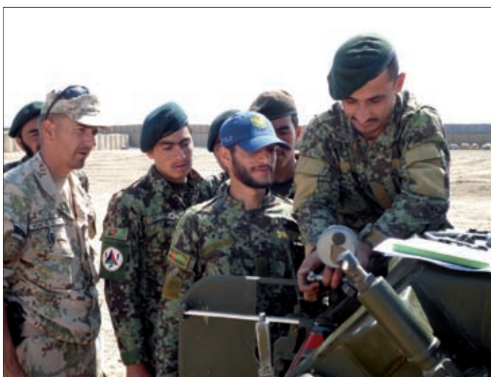
Obrázok 10: Výcvik vojakov Afganskej národnej armády pri príprave dela pred strelbou