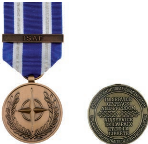
Obrázok 25: Non-Article 5 – Medaila NATO ISAF 25)

Pri plnení operačných úloh v operácii ISAF na území Afganistanu zahynuli traja príslušníci OS SR: