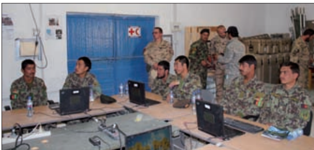
Obrázok 9: Výcvik vojakov Afganskej národnej armády pri vedení kurzu

septembrom 2012 bol tento príspevok navýšený o šiestich profesionálnych vojakov a to o spôsobilosť CSS MAT (D-30). Príspevok OS SR bol vyslaný do operácie ISAF na plnenie úloh výcviku ANA v oblasti obsluhy húfnic D-30 pod velením COM ISAF v celom operačnom prostredí do ukončenia operácie ISAF a to súlade s uznesením NR SR č. 117 z 24. júla 2012. Hlavný dôraz CSS MAT bol sústredený na denné poradenské a asistenčné služby pre 5. CSS Kandak (KDK – prápor) 4. pešej brigády ANA v oblasti výcviku so zameraním na plánovanie, koordináciu a komplexné zabezpečenie. Jednotka bola dislokovaná v Tarin Kowt-e v provincii Uruzgan.