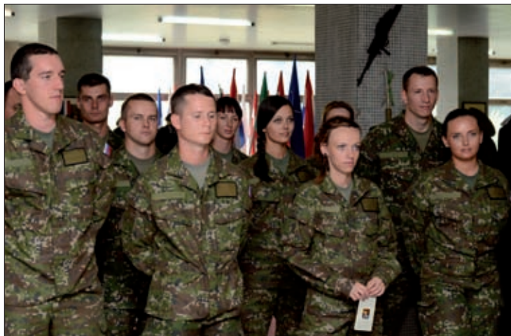
Obrázok 7: Rodová rovnosť