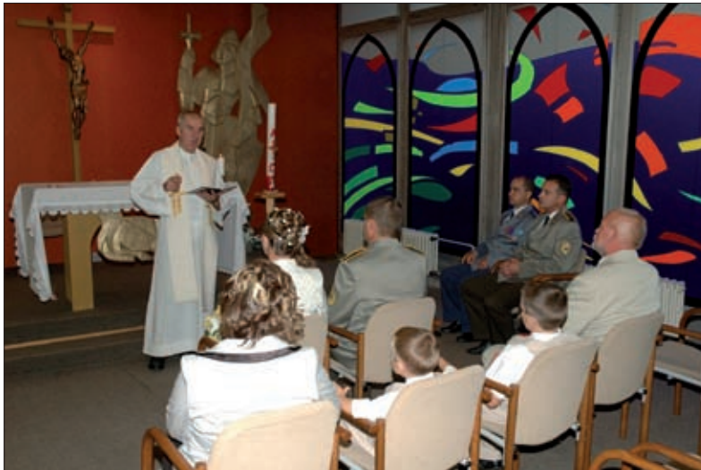
Obrázok 4: Sloboda vierovyznania

Diskriminácia je také konanie, keď sa v tej istej situácii zaobchádza s jedným človekom (skupinou ľudí, organizáciou, krajinou) inak, než s iným človekom (skupinou ľudí, organizáciou, krajinou) na základe jeho odlišností, napríklad rasového alebo etnického pôvodu, vierovyznania, veku, rodu, pohlavia alebo sexuálnej orientácie. Rozhodovanie o tom, či došlo alebo nedošlo ku diskriminácii sa uskutočňuje na základe toho, či existuje príčinná súvislosť medzi znevýhodnením a použitím kritéria pre rozlišovanie. Diskriminácia je v moderných demokratických spoločnostiach považovaná za neprípustnú a jej vyššie vymedzené formy sú v súčasnosti zakazované zákonmi a medzinárodnými zmluvami. Zákaz diskriminácie je vymedzený aj v zákone č. 281/2016 o štátnej službe profesionálnych vojakov a o zmene a doplnení niektorých zákonov, konkrétne v § 4, v ktorom je rozpracované aj dodržiavanie zásady rovnakého zaobchádzania. Tá spočíva v zákaze diskriminácie z dôvodu pohlavia, náboženského vyznania alebo viery, rasy, veku, sexuálnej orientácie, politického alebo iného zmysľania. Občan pri prijímaní do štátnej služby alebo profesionálny vojak, ktorý sa domnieva, že jeho práva alebo právom chránené záujmy boli dotknuté nedodržaním zásady rovnakého zaobchádzania, sa môže domáhať ochrany v služobnom úrade alebo na súde. Služobný úrad je povinný na podnet občana a profesionálneho vojaka bez zbytočného odkladu odpovedať, vykonať nápravu a odstrániť následky nedodržania zásady rovnakého zaobchádzania.