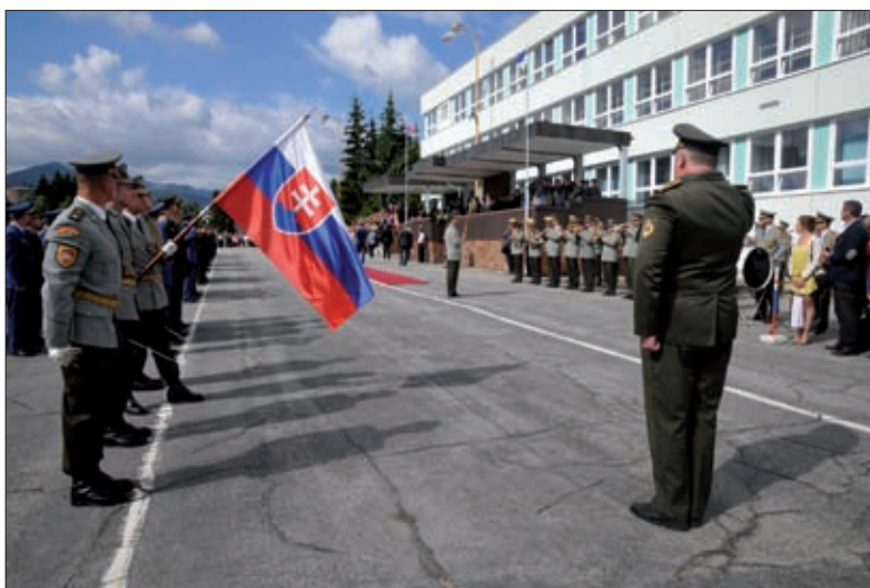
Obrázok 6: Veliteľ pred nastúpenou jednotkou

Osobná dôstojnosť je vyjadrenie predstavy o osobnostnej a sociálnej hodnote každého človeka. Vyjadruje vzťah k sebe samému, vzťah k iným ľuďom, skupinám a vzťah k spoločnosti. Uvedomenie si vlastnej dôstojnosti je forma sebauvedomovania a sebakontroly. Veliteľ vo svojej práci musí dôsledne dbať na to, aby si v náročných podmienkach vojenského povolania zachoval svoju osobnú dôstojnosť, a neznižoval osobnú dôstojnosť svojich podriadených.