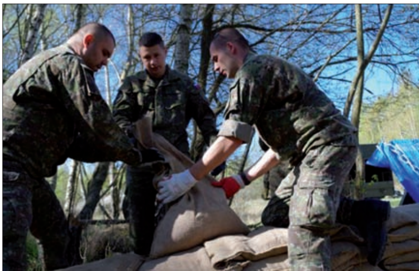
Obrázok 2: Kurz povodňovej záchrany na Lešti

Príkladom sú príslušníci Dopravného práporu Hlohovec, ocenení v roku 2011 v ankete Vojenský čin roka v kategórii „Pomoc verejnosti“. Príslušníci práporu pomohli pri odstraňovaní následkov privalových dažďov v obci Píla.