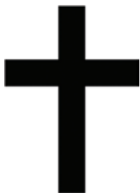
Obrázok č. 2.: Kríž je hlavným symbolom v krešťanstve. Symbolizuje kríž, na ktorý bol podľa Biblie pribitý Ježiš Kristus.

Krešťanstvo je náboženstvom, ktoré vychádza z judaizmu. Jeho sväté texty považuje za svoje, avšak naplňuje ich novým významom a úplne prepracováva systém náboženstva. Je to monoteistické náboženstvo, ktoré sa zameriava na život, učenie a poslanie Ježiša Nazaretského (Ježiša Krista) . V počiatkoch krešťanstvo vyzeralo ako židovská sekta, a aj preto Židia ako prví namietali voči nemu. Hnutie začalo v prvom storočí v Jeruzaleme a rozširovalo sa na sever a západ Stredomoria prostredníctvom misijného pôsobenia Ježišových učeníkov, najmä Petra, Pavla, Jakuba a Jána (okrem iných). Do 4. storočia po Kr. táto malá „sekta“ presiahla všetky ostatné náboženstvá v grécko-rímskej spoločnosti a rozšírila sa po celej Rímskej ríši. Šíreniu napomáhala skutočnosť, že krešťanské poslanstvo bolo otvorene zdieľané s každým, kto ho chcel počuť bez ohľadu na rasu, pohlavie, ekonomické, či spoločenské postavenie.