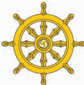
Obrázok 5: Najstarší budhistický symbol Dharmachakra, alebo Koleso Dharmy – symbol reprezentujúci Budhovo učenie o osemdielnej vznešenej ceste. 36)

Týmto svojim kázaním podľa budhistickej tradície „roztočil koleso dharmy“ 35) . „Pravdu o trápení Budha sformuloval takto: Zrodenie je trápenie, starnutie je trápenie, choroba je trápenie, smrť je trápenie, byť spojený s tým, čo nám nie je milé, je trápenie, byť odlúčený od toho, čo nám je milé, je trápenie, ak nedostaneme to, po čom túžime, je trápenie. Tým chcel povedať, že všetko v živote je nejakým spôsobom spojené s trápením. Príčinou vzniku trápenia je smäd, túžba po bytí, po šťastí, po úspechu, po sebauplatnení atď. Uspokojenie túžob zrodí nové túžby, smäd zostáva naďalej a viaže nás k sansáre cez nekonečný rad znovuzrodení, ženúc nás stále k novému uspokojeniu a k stále novému trápeniu. Ukončenie trápenia sa deje skrze uhasenie smädu, postupné utíšenie, až po totálne vykorenenie túžby. Cesta, na ktorej sa to uskutočňuje, je Budhom naznačená, vznešená osemdielna cesta. Pozostáva z nasledujúcich činností: správny názor, správny zámer, správna reč, správne konanie, správne živobytie, správne úsilie, správna bdelosť a správna meditácia.“ 34)