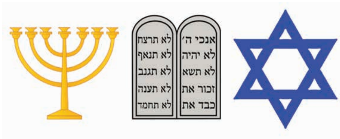
Obrázok č. 1: Symboly judaizmu: Sedemramenný svietnik ( menora ), Tabule Zákona, Dávidova hviezda. 9)

Židovská domácnosť je vybavená schránkou na dverách, ktorá obsahuje biblické citáty písané na pergamene a tabuľkou, ktorá na východnej stene označuje smer modlitby k Jeruzalemu. Okrem modlitebných kníh a náboženskej literatúry sú súčasťou domácnosti aj šabbátové a chanukové svietniky ( menora ).