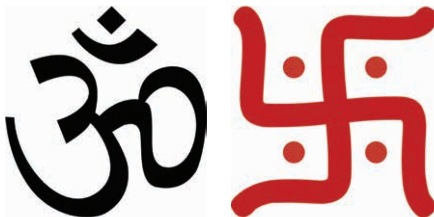
Obrázok č. 4.: Symboly hinduizmu 31)

vali bohom. Okrem štyroch véd ( Rgvéda, Jadžurvéda, Sámavéda, Atharvavéda ) k zbierke patria aj eposy Ramájána a Mahábhárata . Jadro tvorí známa Bhagavadgíta . Rovnako sem patria aj filozoficko-náboženské texty Upanišád , ktoré sa viac zameriavajú na hľadanie vnútorného boha a kladú dôraz na pátranie po podstate univerzálnej sily obsiahnutej vo všetkých veciach. Korene náboženstva teda siahajú do polovice 2. tisícročia pred Kr. Prívrženci náboženstva veria, že je posvätný nielen obsah týchto textov, ale aj zvuk ich slov. Veria, že védy nie sú výtvorom ľudí, ale boli ľuďom zjavené a v ich slovách je ukrytá moc bohov.