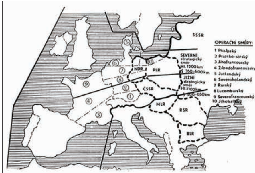
Obrázok 2: Západné bojisko s vyznačením strategických a operačných smerov