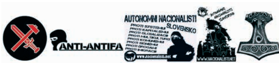
Obrázok 8: Pôvodná pravicová symbolika

Symbol Thórovho kladiva bol prijatý neonacistami a inými rasistami. Bieli rasisti občas spájajú hákový kríž s Thórovým kladivom a starou škandinávskou symbolikou (napr. symbolom hodeného kladiva). Symbol Thórovho kladiva sám o sebe nevyhnutne neznamená rasizmus, ale mal by byť posudzovaný v kontexte, v ktorom sa objavuje.