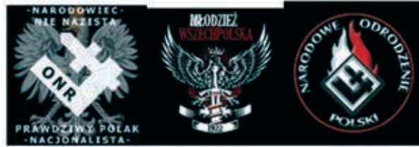
Obrázok 27: Poľské extrémistické skupiny

Poľská národná obroda je národná, radikálna a nacionalistická politická strana. Vytvára protikomunistickú činnosť. Ešte aj dnes pôsobí na poľskej politickej scéne, ale bez výraznejších výsledkov. Vystupuje proti členstvu Poľska v Európskej únii a NATO.