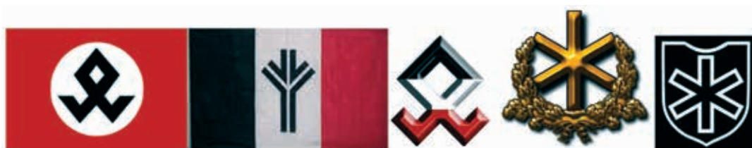
Obrázok 3: Použité runového písma v znakoch

Wl Vlčí hák – je symbolom slobody a nezávislosti. Symbol prevzali aj nacisti. Spôčiatku bol často používaný jednotkami SS.