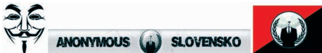
Obrázok 17: Ľavicová symbolika – Anonymous

Anonymous je anonymné a nehierarchické hnutie s anarchistickými prvkami. Začalo sa objavovať na internete v roku 2003 na základe automaticky generovaných prezývok prispievateľa na stránkach 4chan.org a im podobných. Postupne prenikli do masmédií, čo bolo zapríčinené záujmom o ich hackerské útoky napríklad proti firme Sony (Operácia Sony). V roku 2012 zaútočil Anonymous aj na slovenské štátne stránky. Ich konanie je sporadické.