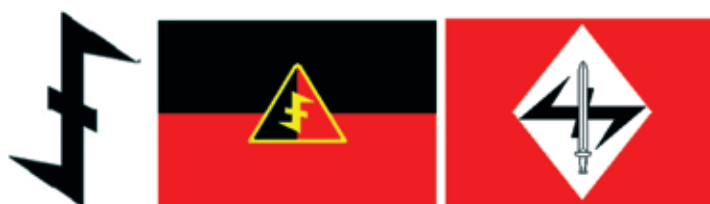
Obrázok 7: Vlčí hák

Vlčí hák bol symbolom jednotiek Werwolf, ktoré pôsobili za nepriateľskými líniami až do roku 1946. Vlčí hák zároveň používali členovia a príslušníci holandskej národnosocialistickej strany. V súčasnosti vlčí hák často používajú vo svojej symbolike pravicovo-extrémistické a neonacistické skupiny a organizácie, napríklad švédska neonacistická organizácia Biely árijský odpor. 11)