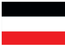
Obrázok 1: Ríšska vlajka v období rokov 1871 – 1918 a 1933 – 1935

Používanie prevzatej symboliky je charakteristické pre pravicový extrémizmus. Prvú skupinu symbolov tvoria ariosofické symboly. Tieto symboly majú politické korene v ľudovej ideológii z konca 19. storočia, v ariosofii, t. j. návrate k základným náboženským hodnotám, oživovaní záujmu o panteizmus, okultizmus a návrate k pohanstvu a nordickému ľudovému mysticismu. Ariosofia bola založená na myšlienke „čistej árijskej rasy“. Vzrastal záujem o rasovú vedu, teóriu o hlavnej rase, darwinizmus a Hitlerovu rasovú ideológiu, ktoré tvoria základnú myšlienku a pôvod ideológie národného socializmu, nacistickej politickej strany NSDAP a aj nacistického Nemecka.