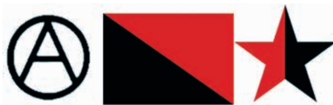
Obrázok 13: Ľavicová symbolika anarchistická

Najpoužívanejšou vlajkou anarchistov je červeno-čierna vlajka, kde červená farba označuje revolúciu, krv, socializmus a čierna anarchiu. Niekedy sa ako symbol anarchie používa len čierna vlajka.