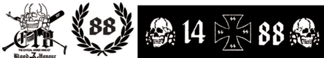
Obrázok 9: Pôvodná pravicová symbolika čísiel

a v elektronickej pošte alebo aj ako skratka v e-mailových adresách a používateľských menách na sociálnych sieťach. Často sa používa aj spoločná kombinácia číselných symbolov 14 (slov) a 88.