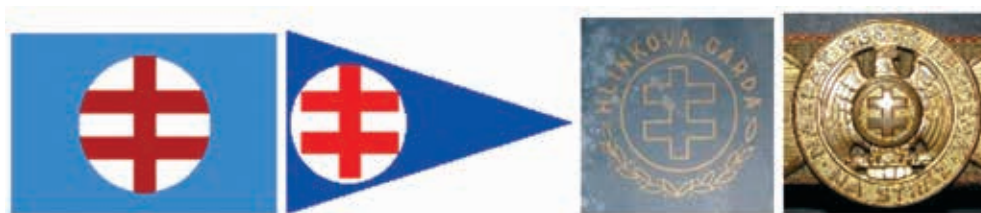
Obrázok 22: Hlinkova garda

Hlinkova garda (HG) bol polovojenský poriadkový zbor zriadený v rámci Hlinkovej slovenskej ľudovej strany ako pomocný orgán štátnych úradov. Po vzniku prvej slovenskej republiky sa aktívne podieľala na perzekúciách Čechov, Rómov, Židov a demokraticky zmýšľajúcich Slovákov, neskôr na deportáciách židovského obyvateľstva. 28. októbra 1938 sa Hlinkova garda stala jedinou brannou organizáciou na slovenskom území. Od septembra 1944 sa stala popri Domobrane zložkou ozbrojených bezpečnostných síl Slovenského štátu. Od jari 1945 usmerňoval jej činnosť veliteľ nemeckých vojsk na Slovensku. Porážkou nacizmu bola Hlinkova garda rozpustená, jej predstavitelia a aktívni prívrženci boli väčšinou postavení pred súd. V zmysle Nariadenia Slovenskej národnej rady č. 33 zo dňa 15. mája 1945 o potrestaní fašistických zločincov, okupantov, zradcov a kolaborantov a o zriadení ľudového súdництва (ktorého platnosť a účinnosť nebola nikdy zrušená) boli osoby, ktoré sa podieľali na vyššie uvedených aktivitách kvalifikované ako kolaboranti a boli odsúdení na trest odňatia slobody vo výške do 30 rokov. 18)