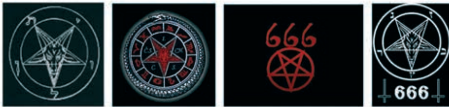
Obrázok 20: Náboženská symbolika

Číslica 666 predstavuje číslo diabla (zla a hriechu), šelmy (apokalyptickej bestie) spomínaných v knihe Zjavenie svätého Jána z Nového Zákona, je to číslo Antikrista. Antikrist je v kresťanstve označovaný ako nepriateľ Ježiša Krista, Boha a jeho nasledovníkov kresťanov. Často sa vyobrazuje spoločne s pentagramom. 16)