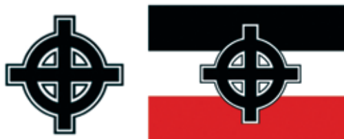
Obrázok 6: Keltský kríž

Keltský kríž je známy aj pod názvom Odinov kríž. Jeho väzba na neonacizmus vychádza aj z jeho používania Ku-Klux-Klanom. Stal sa jedným z najobľúbenejších symbolov pravicových extrémistov. Vidno ho na štadiónoch na vlajkách alebo šáloch futbalových chuligánov. Je obľúbeným motívom pri tetovaní.