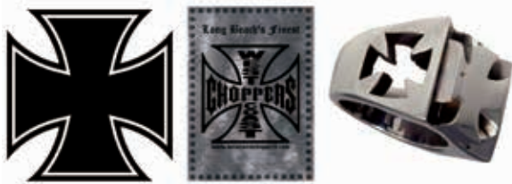
Obrázok 5: Železný kríž

Keltský kríž je známy aj pod názvom Odinov kríž. Jeho väzba na neonacizmus vychádza aj z jeho používania Ku-Klux-Klanom. Stal sa jedným z najobľúbenejších symbolov pravicových extrémistov. Vidno ho na štadiónoch na vlajkách alebo šáloch futbalových chuligánov. Je obľúbeným motívom pri tetovaní.