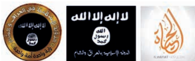
Obrázok 21: Náboženská symbolika – Islamský štát

Islamský štát je sunitská militantná teroristická organizácia, ktorá od roku 2014 ovláda rozsiahle časti Iraku a Sýrie. Jej cieľom je obnova kalifátu založeného na striktnej interpretácii islamského práva šarija. Organizácia sa hlási k novej ére medzinárodného džihádu. K Islamskému štátu sa neskôr začalo hlásiť aj viacero ďalších radikálnych džihádistických organizácií po celom svete, predovšetkým v Líbyi, v Nigérii (Boko Haram) alebo v Somálsku (Al-Shabaab). Organizácia pácha brutálne teroristické útoky a vojnové zločiny, vrátane masových poprav zajatých vojakov a civilistov. Na dobytých územiach sa dopúšťa všeobecného porušovania ľudských práv a brutálne utláča všetky náboženské skupiny, ktoré nevyznávajú ich striktnú verziu islamu. 17)