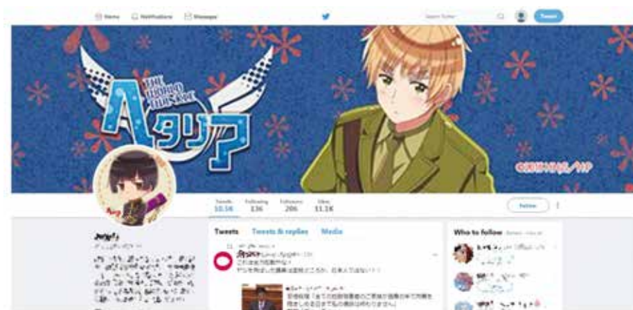
Obrázok 4: Bot aktívny počas japonských volieb v roku 2017 44)

sieťové služby. Tie posledné pritom predstavujú silnú živnú pôdu pre aktérov zámerne tvoriacich a šíriacich nepravdivý a zavádzajúci obsah, ktorí využívajú spôsob fungovania SSS na amplifikáciu svojho obsahu. V rámci amplifikačných ciest na SSS možno hovoriť o polo/automatizovaných a manuálnych prístupoch. K prvému uvádzanému možno napríklad priradiť možnosť zaplatenia reklamy na daný príspevok. Ďalším populárnym nástrojom z tejto kategórie sú boty, t. j. softvérové programy, ktoré automaticky dokážu zdieľať príspevok obsahujúci isté kľúčové slová, pričom už technicky priemerne zdatný človek dokáže vytvoriť stovky, resp. aj tisíce takýchto botov. Z viacerých výskumov, primárne na sociálnej sieťovej službe Twitter, vyplýva, že boty sú obľúbeným nástrojom, ktorý je využívaný napríklad počas predvolebných kampaní vo viacerých štátoch sveta. 43) Ilustráciou môže byť bot aktívny počas japonských volieb v roku 2017 (obrázok 4). Nie na každú situáciu je však vhodné využiť automatizované prístupy amplifikácie, nakoľko tieto sú relatívne ľahko detekovateľné a vypátratelné.