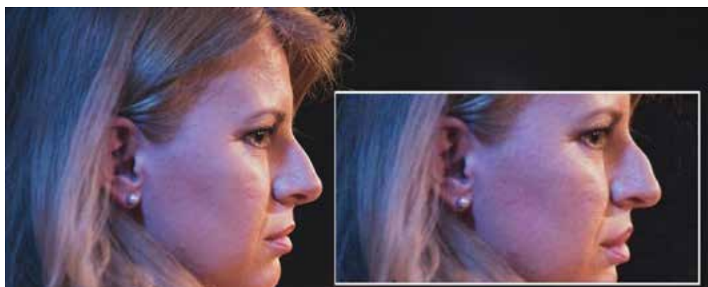
Obrázok 2: Upravená fotografia Zuzany Čaputovej 41)

Čo sa týka modi operandi tvorby nepravdivých a zavádzajúcich informácií, aktéri samozrejme nevytvárajú vždy nový obsah, ale častokrát s menšími alebo väčšími úpravami len preberajú obsah zo zahraničia. V rámci kategorizácie možno teda hovoriť o obsahu primárne domácej alebo zahraničnej provinienencie. Príkladom prvej kategórie je napríklad zámerne upravená fotka z roku 2019 (obrázok 2), na ktorej je vtedajšia prezidentská kandidátka Zuzana Čaputová. Časopis Zem a Vek, ktorý fotku upravil a použil spolu s textom o liberálnom zle na nej Z. Čaputovej zakrivil nos a upravil pery spôsobom pripomínajúcim antisemitskú propagandu, ktorej cieľom bolo poukazovať na „židovské črty“.