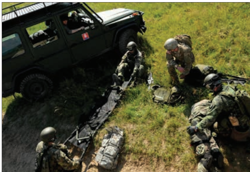
Obrázok 3: 5. pluk špeciálneho určenia

vých operáciách a zapájala sa aj do provinčných rekonštrukčných tímov. Do Afganistanu boli nasadené aj jednotky operačného výcvikového a styčného tímu, tímy na likvidáciu nevybuchutej munície a improvizovaných výbušných prostriedkov a prieskumné jednotky. Misia ISAF bola ukončená a rozpustená v decembri 2014. Niektoré jednotky, vrátane slovenských, však v Afganistane zostali až do súčasnosti ako súčasť misie Rozhodná podpora (ďalej len „RS“, angl. Resolut Support), ktorej úlohou je výcvik a podpora afganských národných bezpečnostných síl. V roku 2018 sa na misii RS zúčastnilo 35 príslušníkov OS SR.