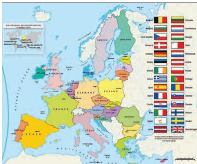
Obrázok 2: Členské krajiny Európskej únie

Integrácia ďalších európskych krajín prebiehala aj naďalej. V roku 1995 sa pripojili vyspelé krajiny Európskeho združenia voľného obchodu, a to Rakúsko, Fínsko a Švédsko. Významným krokom, ktorým sa naplnili ustanovenia Maastrichtskej zmluvy, bolo rozhodnutie 11 krajín Únie zaviesť spoločnú európsku menu – euro. Táto mena vošla do obehu v roku 2002.