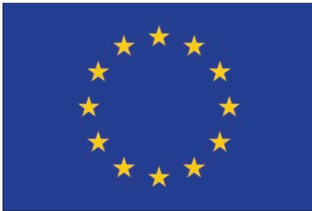
Obrázok 1: Vlajka Európskej únie

Cesta Slovenskej republiky do Európskej únie (ďalej len „EÚ“ alebo „Únia“) bola obdobná ako cesta do Severoatlantickej aliancie. Podobne ako pri vstupe do NATO, muselo Slovensko pri svojich snahách o členstvo v EÚ podstúpiť mnohé právne kroky, spoločenské a ekonomické zmeny. Tieto zmeny boli potrebné vzhľadom na to, že v poslednom desaťročí 20. storočia demokracia na Slovensku po dlhom období totalitárneho režimu iba začínala. 1. mája 2019 si pripomíname 15. výročie vstupu do Európskej únie. Môžeme jednoznačne zhodnotiť, že svojim vstupom do EÚ sa Slovensko zaradilo medzi najvyspelejšie demokracie sveta.