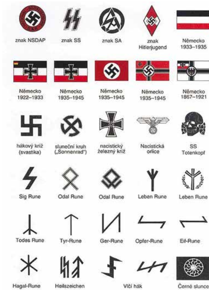
Obrázok 2: Nacistická a neonacistická symbolika