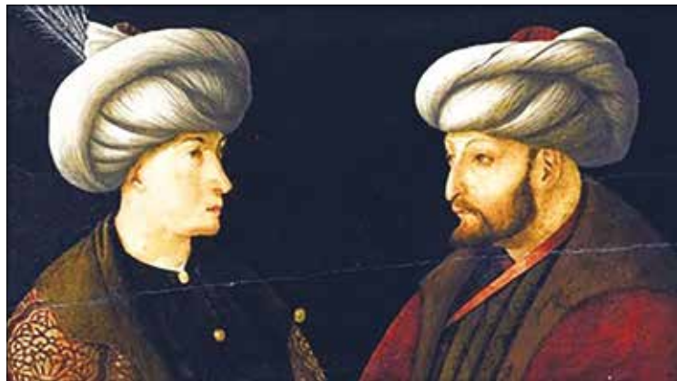
Obrázok 5: Portrét Mehmeda II. so synom (neskôr sultánom Cemom)

Situácia v Byzantskej ríši sa vyvíjala v jej neprospech až do roku 1402, kedy dobyvateľ zo Strednej Ázie Timur porazil Osmanov a zajal sultána Bajezida I. Toto vyvolalo u Osmanov občiansku vojnu, ktorá trvala do roku 1413. Po jedenástich rokoch bol Mehmed I. uznaný za sultána. Jeho prostredníctvom ako autority ríše sa moc Osmanov obnovila. Mehmed II., vnuk Mehmeda I. pokračoval v rozpínaní osmanskej ríše dobíjaním ďalších území Ázie. Mehmed II. Dobyvateľ ako 21-ročný sultán demonštroval vojenskú silu štátu dobytím Konštantínopolu v roku 1453.