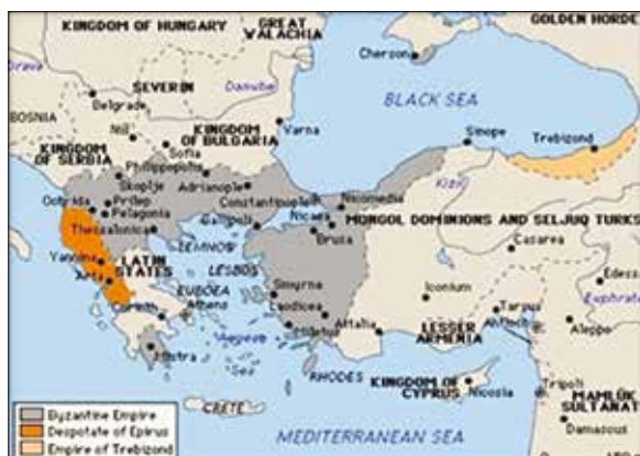
Obrázok 3: Byzantská ríša

v roku 1204, kedy sa križiaci proti pôvodnému zámeru obrátili proti „schizmatickým Grékom“, ako označovali pravoslávne obyvateľstvo. Hlavným motívom nepochybne bolo neskutočné bohatstvo Konštantínopolu.