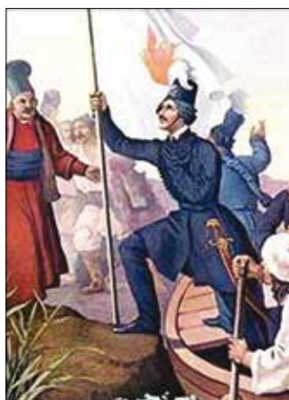
Obrázok 7: Deklarácia revolúcie Grékov Alexandrosom Ypsilantisom 7)

Paradoxne grécka revolúcia sa nezačala na gréckom teritóriu, ale na území Moldavska a dnešného Rumunska. Na jej čelo sa postavil Alexandros Ypsilanti (1792 – 1828). Bol síce Grék, no dôstojník v službách ruského cára Alexandra I. Alexandros Ypsilanti (obrázok 7) sa neskôr stal vodcom spolku „Filiki eteria“, ktorý v roku 1818 začal posielat' svojich členov agitovať proti osmanským názorom medzi Srbov a Bulharov. Títo členovia spolku sa nazývali apoštoli. Filiki eteria uspela aj medzi obyvateľmi na Peloponéze prostredníctvom vplyvnej rodiny Petrosa Mavromichalisa.