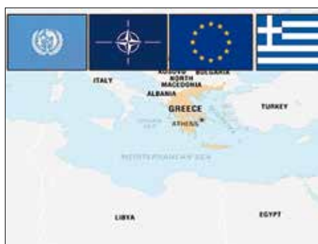
Obrázok 1: Geografická poloha Grécka 2)

Grécko je krajina, ktorá sa rozprestiera v Európe, je súčasťou Balkánu, oblasti Stredozemného mora a taktiež sa nachádza v blízkosti Východu, čiže krajín, kde prevažujúcim náboženstvom je islam.