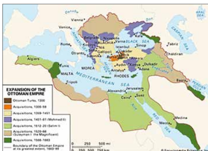
Obrázok 4: Rozmach Osmanskej ríše za vlády Sulejmána I. 4)

Okrem „Frankov“, ako boli súhrne označovaní francúzski, talianski i nemeckí rytieri, zohrali v týchto udalostiach dôležitú úlohu najmä Benátky a ich dóža Enrico Dandolo. Dobyvatelia si rozdelili byzantské územia. Jednu štvrtinu zahŕňalo tzv. Latinské cisárstvo s centrom v Konštantínopole. Na Peloponéze, vtedy nazývanom Morea, vzniklo Achájske kniežatstvo. V období nadvlády „Latinov“ západoeurópske feudálne zvyklosti dali základ koloniálnej politike a obrovskému bohatstvu Benátskej republiky. Benáťania sa vo východnom Stredomorí stali na niekoľko storočí námornou a obchodnou veľmocou. Do ich správy spadali grécke prístavy a mnoho ostrovov v Iónskom aj Egejskom mori. Byzantínci však úplne nepodľahli vplyvu Benátskej republiky a v Malej Ázii založili tzv. Nikkajské cisárstvo. V roku 1259 Michael VIII. Palaiologos, pôvodom z franskej rodiny Villehardouinov, dobyl polostrov Peloponéz a urobil z mesta Mystru svoje sídlo. V Mystru pôsobilo mnoho vynikajúcich byzantských umelcov, architektov, intelektuálov a filozofov. V roku 1261 dobyli Palaiologovci Konštantínopol späť, ale ríša už bola len tieňom svojej bývalej slávy a permanentne sa zmiatla v politických a hospodárskych krízach.