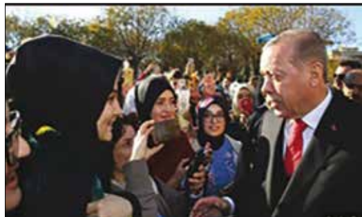
Obrázok 11: Návšteva prezidenta Recep Tayyip Erdogana 25)

Prezident Erdogan pobúrili hostiteľov tvrdením, že Atény diskriminujú 130 000 príslušníkov moslimskej menšiny. Doslovne vyhlásil: „Urobili sme veľmi dôležité rozhodnutia, aby sme uspokojili potreby etnických Grékov, ktorí sú tureckými občanmi. Máme teda právo očakávať, že sa Grécko zachová rovnako“.