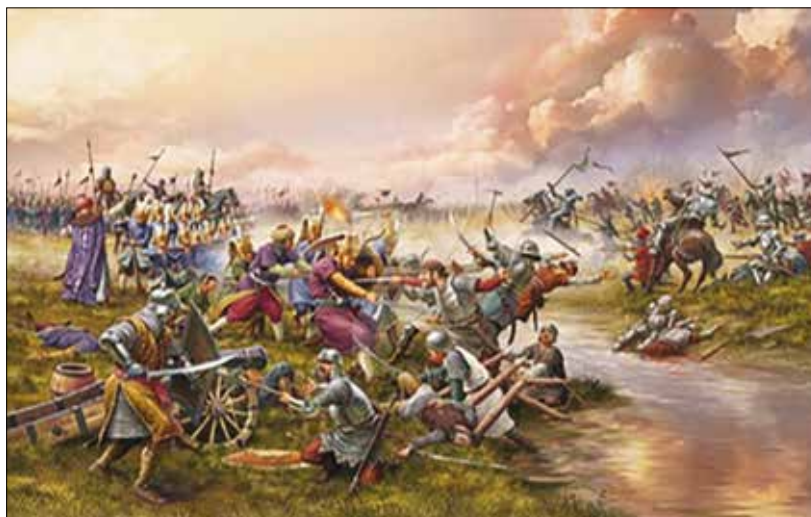
Obrázok 6: Bitka pri Moháči

Po Sulejmanovej smrti nasledovalo obdobie vlády „slabých“ sultánov, ktoré spôsobilo oslabenie Osmanskej ríše. Napriek tomu však Osmanská ríša bola jednou z najvýznamnejších mocností, no jej expanzia sa zastavila v roku 1683 po neúspešnom obliehaní Viedne. V tomto období sa Turci s obrovským vojskom ocitli najbližšie k dobytíu tejto metropoly. Lenže záverečný útok dlho odkladali a to napokon viedlo k tomu, že Viedni prišli na pomoc habsburské, nemecké a poľské vojská na čele s poľským kráľom Jánom Sobieskim a donútili Turkov stiahnuť sa. Mementom tejto významnej udalosti je socha kráľa Jána Sobieskeho, ktorá sa nachádza na území Slovenska v meste Štúrovo. 6)