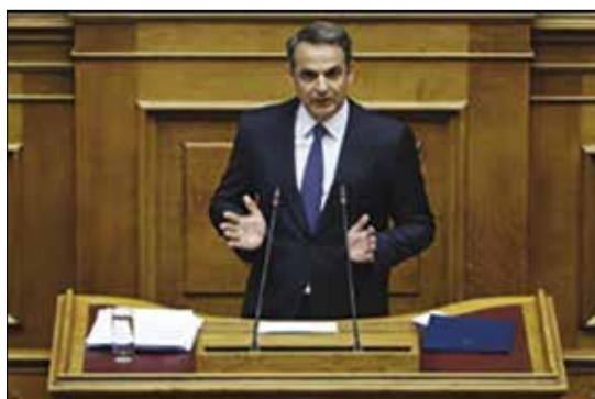
Obrázok 12: Grécky premiér Kyriakos Mitsotakis 26)

Napriek vyjadreniam tureckého prezidenta grécky premiér Kyriakos Mitsotakis (obrázok 12) privítal 29. júla 2019 pripravované stretnutie lídrov gréckej a tureckej časti Cypru, ktorí sa mali venovať možnosti obnovenia rozhovorov o zjednotení.