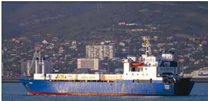
Obrázok 13: Nákladná loď Cirkin 27)

Jedným z príkladov je incident, ktorý 17. júna 2020 zverejnilo ministerstvo obrany Francúzska. V tento deň príslušníci francúzskeho vojenského námorníctva chceli v Stredozemnom mori skontrolovať nákladnú loď „CIRKIN“ (obrázok 13) pre podozrenie, že vezie zbrane do Líbye, čo je zakázané na základe embarga OSN. Turecké fregaty, ktoré sprevádzali nákladnú loď vtedy trikrát vykonali radarové zameriavanie francúzskej lode, pretože bola naznačená bezprostredná hrozba raketového útoku.