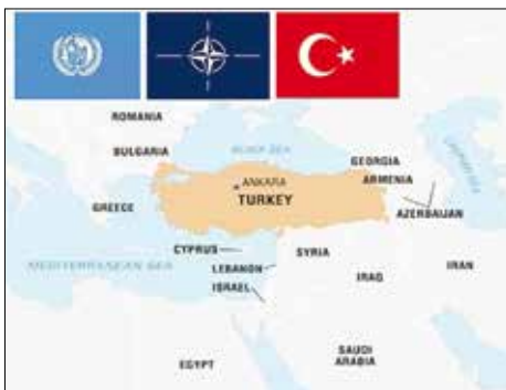
Obrázok 2: Geografická poloha Turecka 3)

V porovnaní s európskymi krajinami rozloha Turecka prevyšuje rozlohu akejkoľvek európskej krajiny. Väčšinová časť Turecka sa nachádza v Ázii. V európskej časti sa nachádza Anatólia a východná časť Arménskej vysočiny. 2)