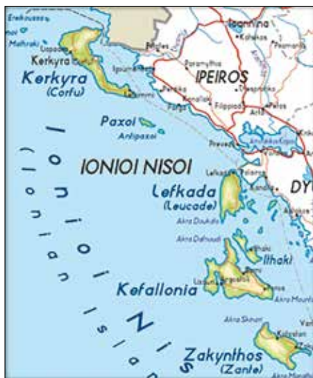
Obrázok 8: Geografická poloha Iónskych ostrovov 10)

O dva roky neskôr (1864) bola prijatá nová, relatívne demokratická ústava obmedzujúca kráľovské právomoci. V skutočnosti sa ale nový panovník snažil rozhodovať o všetkom sám.