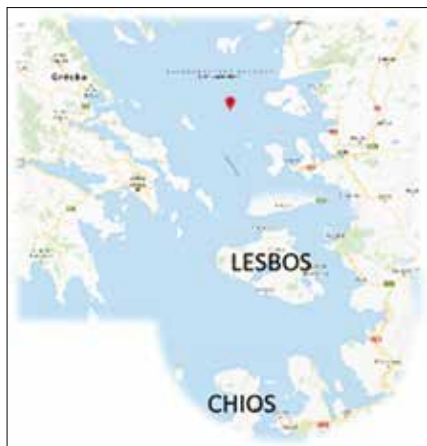
Obrázok 10: Poloha ostrovov Lesbos a Chios

Kavala, asi 150 km od Solúna. V rokoch 1972 – 1973 západne od ostrova Thasos boli objavené ložiská zemného plynu v oblasti „Južná Kavala“ a ložiská ropy pri ostrove Prinos. Ťažba nerastného bohatstva v tomto regióne bola problematická, pretože Turecko nebolo ochotné uznať výsostné práva Grécka a hlásilo sa o svoj podiel. 17)