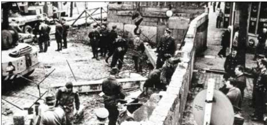
Obrázok 3: Stavba Berlínskeho múru

Po skončení druhej svetovej vojny sa svet presunul rovno do studenej vojny, ktorá rozdelila Európu železnou oponou na dva znepriatelené tábory. Pod pojmom železná opona je chápaná pomyselná hranica oddelujúca západ (NATO) a východ (krajiny Varšavskej zmluvy). Tiahla sa od Poľska až k Terstu na Jadrane. Symbolom studenej vojny sa stal Berlínsky múr.