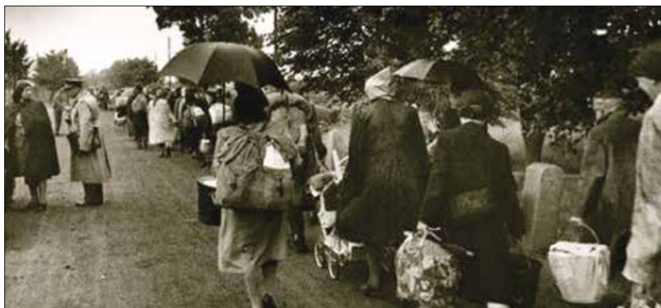
Obrázok 1: Odsun nemeckého obyvateľstva z Československa

Po negatívnych skúsenostiach z druhej svetovej vojny sa v roku 1945 mnoho štátov rozhodlo zastávať myšlienku jednoliatych národov. Obávali sa nárastu nacionalistických myšlienok národnostných skupín, tak ako tomu bolo v roku 1938, keď Adolf Hitler využil myšlienku ochrany Nemcov v okolitých krajinách pre získanie územia. Túto taktiku využil pri „ochrane“ Nemcov v Rakúsku a následne aj v časti Československa (v Sudetách), ktoré si pripojil k nacistickému Nemecku. V Československu po roku 1945 išlo o vyriešenie národnostnej otázky s nemeckou a maďarskou menšinou. Do platnosti vstúpili tzv. Benešove dekréty, ktoré v prípade neobhájenia štátnej spoľahlivosti zbavovali týchto občanov občianstva a následne boli nútení opustiť Československo. Dekrét číslo 33/1945 upravoval viaceré otázky vzťahov k nemeckej a maďarskej menšine po vojne a napríklad aj v majetkových sankciách. O samotnom odsune Nemcov už predtým rozhodla postupimská mierová dohoda.