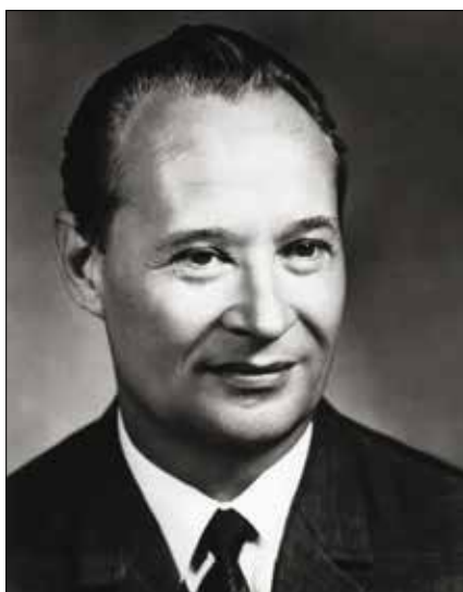
Obrázok 4: Alexander Dubček

Hlavní dvaja súperia studenej vojny, USA a Sovietsky zväz, na seba nikdy priamo nezaútočili. Navzájom sa zastrašovali použitím jadrových zbraní. Obe súperiace veľmoci podporovali viaceré menšie krajiny. Počas tohto obdobia vypuklo viacero vojnových konfliktov podporovaných týmito mocnosťami. Až v 60-tych rokoch prišlo k uvoľňovaniu napätia vo východnom bloku. Túto situáciu využili aj politické špičky v Československej socialistickej republike. Do popredia sa dostal Alexander Dubček, ktorý bol označovaný ako „politik s ľudskou tvárou“. V krajine bola zrušená cenzúra a zo spoločnosti sa vytrácal strach a teror, ktorý šířila komunistická strana.