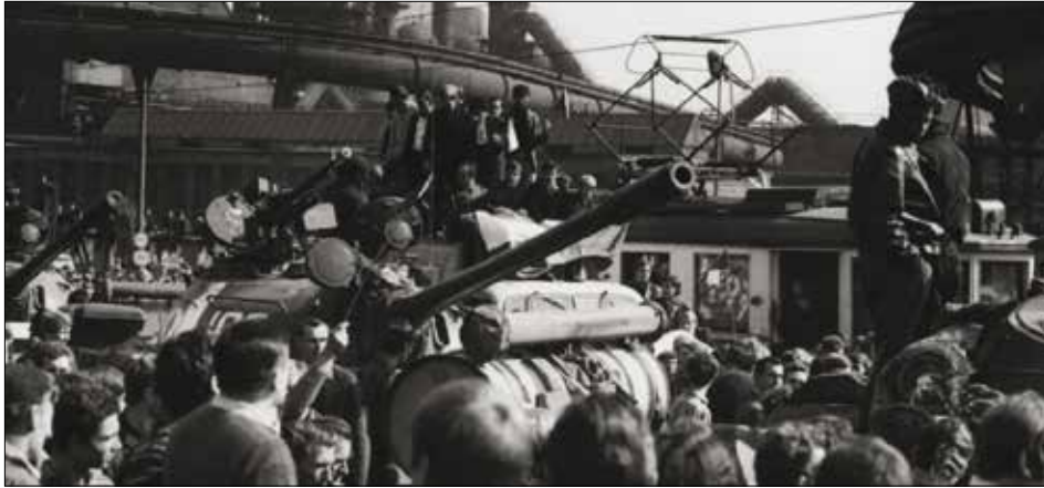
Obrázok 5: 21. august 1968 v Ostrave

Na hraniciach ich ale čakalo veľké množstvo pohraničníkov so psami, ostnaté drôty, mínové polia, ktoré tam neboli kvôli možnému útoku zo západu, ale preto aby zabránili prechodu občanov z východného bloku na západ. Tieto prechody štátnej hranice si vyžiadali stovky obetí.