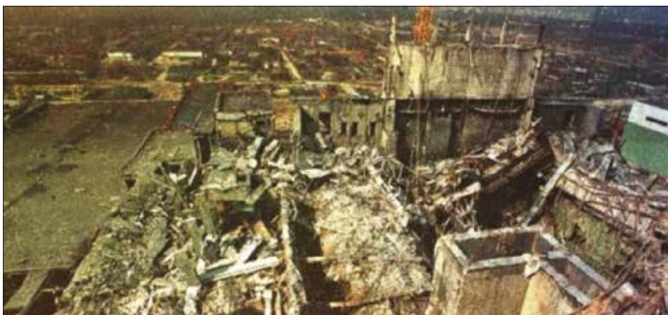
Obrázok 6: Havária jadrovej elektrárne v Černobyli

V roku 1986, konkrétne 26. apríla, došlo k havárii štvrtého bloku jadrovej elektrárne Vladimíra I. Lenina (známejšej pod názvom Černobyľ). Rádioaktívny mrak zamoril najprv celé okolie elektrárne a postupne ho vzdušné prúdy preniesli po celej Európe. Z mesta Pripjat' a okolitých obcí bolo evakuovaných viac ako 200 000 ľudí. Väčšina z nich sa domov už nikdy nevrátila. Obyvatelia boli presúvaní po ZSSR a niektorí sa dostali aj do ČSSR.