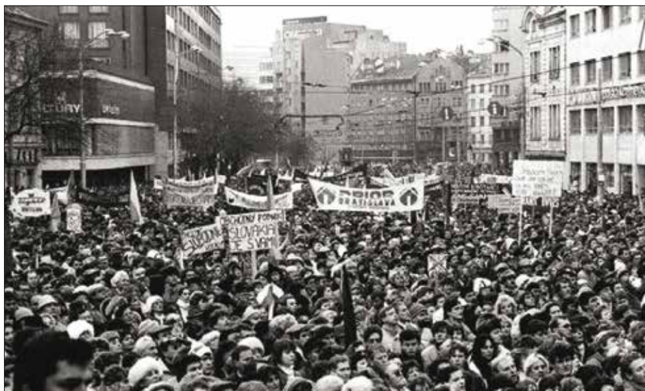
Obrázok 7: 17. november 1989

Koncom osemdesiatych rokov prišlo k postupnému pádu viacerých komunistických režimov v Európe. Na území ČSSR nespokojnosť s režimom vyvrcholila 17. novembra 1989, kedy sa v Prahe odohral spomienkový akt na študentov, ktorí zahynuli v roku 1939. Spomienková akcia bola tvrdo rozohnaná štátnou políciou. Tento brutálny zásah pobúrila celú verejnosť, ktorá sa začala pridávať k protestujúcim.