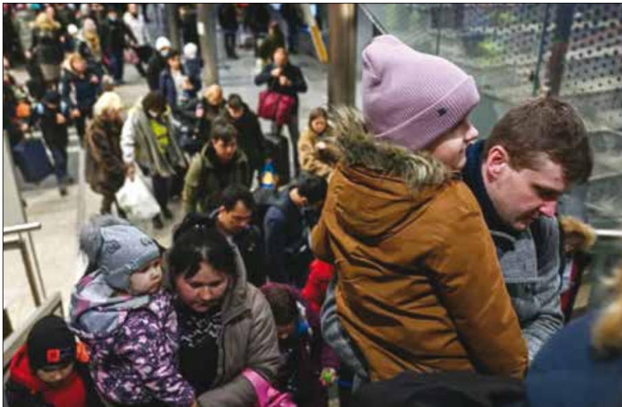
Obrázok 8: Ukrajinskí utečenci

Dňa 24. februára 2022 sa z pohľadu Slovenskej republiky zmenilo vnímanie bezpečnosti v strednej Európe, ale aj pojmu utečenecká kríza. Väčšina utečeneckých kríz z minulosti sa Slovenska týkala len veľmi okrajovo a prakticky sme sa iba učili ako pracovať s ľuďmi, ktorí chcú žiadať o azyl na Slovensku. Koncom februára 2022 sa však vnímanie utečeneckej krízy úplne zmenilo. Útokom Ruska na svojho suverénneho suseda Ukrajinu zažila Európa niečo, čo nebolo na tomto území od konca druhej svetovej vojny, čiže viac ako 76 rokov. Táto „špeciálna vojenská operácia“, ktorej cieľom bola, ako ruská strana deklarovala, „denacifikácia Ukrajiny“ je v skutočnosti vojnou Ruska proti suverénnemu Ukrajinskému štátu. Táto vojna dala do pohybu milióny ukrajinských utečencov, ktorí utekali aby si zachránili svoj holý život.