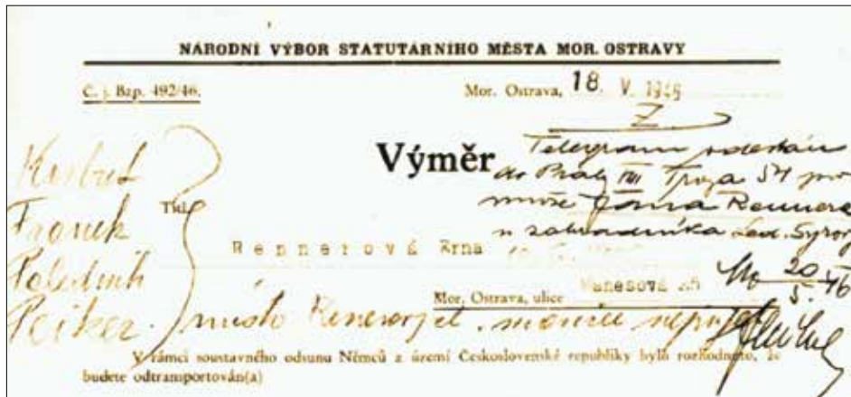
Obrázok 2: Výměr na odsun z územia Československa

Druhou najpočetnejšou menšinou v obnovenj ČSR bola maďarská národnosť. Po prinavrátení južného územia Slovenska, ktoré bolo zabrané počas Viedenskej arbitráže (1938), získalo Československo naspäť svoje územia. Toto územie bolo osídlené prevažne maďarským obyvateľstvom. Československá vláda v spolupráci s maďarskou sa dohodli na tzv. koordinovanej výmene obyvateľov. Išlo o miernejšie presídlenie ako pri už spomínaných Nemcoch. Aj tak to však bolo násilné presídľovanie z jedného územia na druhé. Koľko obyvateľov malo byť presídlených zo Slovenska, toľko ich malo byť presídlených z Maďarska. Pre nízky záujem zo strany presídľovaných, bola časť obyvateľov južného Slovenska premiestnená do Sudet (hraničného územia Nemecka a Česka), kde zostalo veľké množstvo prázdnych domov po odsunutých Nemcoch.