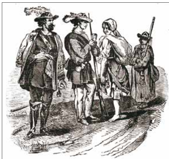
Obrázok 3: Slovenskí dobrovoľníci s dôstojníkom a markytáňkou v roku 1849