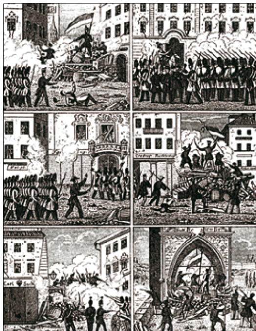
Obrázok 2: Boje na pražských barikádach (1848)

(Zdroj: RUDL, J.: Die Barrikaden Prag's in der verhängnißvollen Pfingstwoche 1848.