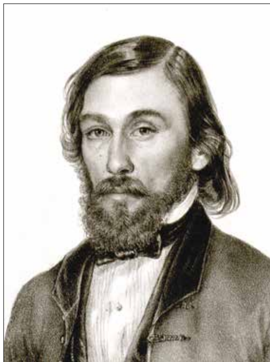
Obrázok 1: Jozef Miloslav Hurban

V tejto atmosfére aj J. M. Hurban pochopil, že „už sme sa dost' napísali a nanarádzali všelijakých rád, teraz treba zmužilo pristúpiť k dielu, (...) vyzvať národ k hláseniu sa o právo svoje, aby sloboda nezostala pre nás na papieri a pre iných na tanieri“ , a po 19. marci pristúpil k činu. Najskôr odcestoval za Štúrom do Bratislavy, a potom do Viedne, aby nadviazal spoluprácu s reprezentantmi rakúskych Slovanov. Po návrate rozvinul v podbradliansko-podjavorinskej oblasti (v Brezovej pod Bradlom, na Myjave, vo Vrbovciach) agitačnú a petičnú akciu. Zaobstaral si jazdeckého koňa a v záujme bezpečnosti si ešte cestou z Viedne zakúpil šabľu, tri dvojhlavňové pušky (duplonky), pištole, pušný prach a gule. V medziach zákonov organizoval verejné ľudové zhromaždenia, so zápalom rečnil z koňa, prične i zo stola, poukazoval na medzery v marcových zákonoch, čím sa mu darilo osloviť najmä kopaničiarskych roľníkov, ktorých sa zrušenie poddanstva nedotklo, a zároveň upozorňovať na práva slovenského národa. Kde prítomný nebol, tam svoju výzvu k činu šíril letákom Bratia Slováci: „A veru my nesmieme čušať, keď iní spievajú, a slúžiť, keď iní panujú, a plaziť sa, keď iní hlavy dvíhajú, a zúfať, keď iní triumfujú! Aj nám, aj nám, Slovákom statočným udrél zvon slobody.“