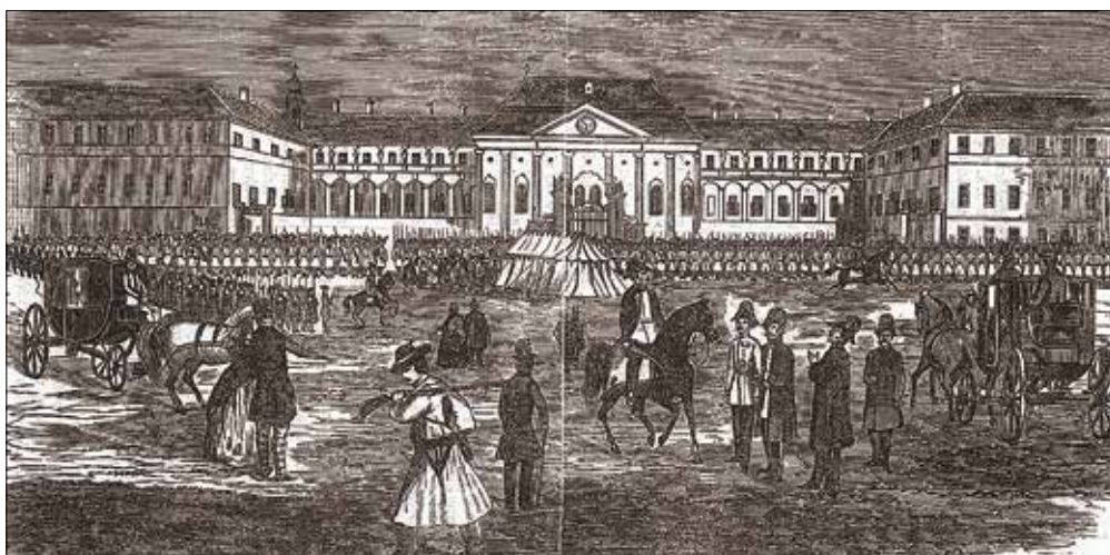
Obrázok 6: Rozpustenie dobrovoľníckeho zboru dňa 21. novembra 1849 (kresba z roku 1862) (Zdroj: Sokol, roč. 1, 1862, č. 11, s. 413)

V tomto období sa slovenským vodcom dostávali za ich „služby“ len slabé garancie: rečové práva, vydávanie slovenských novín a slovenské úradovanie. Od konca júna bol Hurban (aj ďalší Slováci) vymenovaný do pozície ľudového dôverníka – agitátora viedenskej politiky, cieľov rakúskej armády, no aj slovenských záujmov. Keďže sa však pôsobnosť dôverníkov obmedzovala len na región ich bydliska, bez možnosti nadviazať kontakt s ozbrojeným zborom, aj Hurban sa v júli pohyboval v jemu blízkom kraji, od Holíča až po Starú Turú. Hoci sa ľudoví dôverníci snažili zriaďovať slovenskú verejnú správu, dosadzovaním slovenských vlastencov aj nešľachtických vrstiev, z miestnych a stoličných úradov ich vytláčali Viedni lojálni maďarskí a promaďarskí šľachtickí konzervatívci. Kritiku voči tomu vzniesli Hurban, Štúr a Bórik v dokumente Promemórium (22. august 1849) adresovanom ministrovi vnútra Alexandrovi Bachovi. Ich zviditeľňovanie sa vo vysokých viedenských kruhoch pokračovalo aj na jeseň, po porážke revolúcie v Uhorsku. Slovenská politická reprezentácia nechcela totiž premeškať chvíľu, keď sa začalo rokovať o osude „porazeného Uhorska“; od polovice septembra do polovice októbra preto rozvinula masové petičné hnutie.