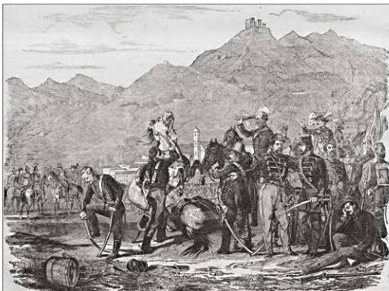
Obrázok 5: Világošská kapitulácia maďarských revolučných vojsk

V tomto období sa slovenským vodcom dostávali za ich „služby“ len slabé garancie: rečové práva, vydávanie slovenských novín a slovenské úradovanie. Od konca júna bol Hurban (aj ďalší Slováci) vymenovaný do pozície ľudového dôverníka – agitátora viedenskej politiky, cieľov rakúskej armády, no aj slovenských záujmov. Keďže sa však pôsobnosť dôverníkov obmedzovala len na región ich bydliska, bez možnosti nadviazať kontakt s ozbrojeným zborom, aj Hurban sa v júli pohyboval v jemu blízkom kraji, od Holíča až po Starú Turú. Hoci sa ľudoví dôverníci snažili zriaďovať slovenskú verejnú správu, dosadzovaním slovenských vlastencov aj nešľachtických vrstiev, z miestnych a stoličných úradov ich vytláčali Viedni lojálni maďarskí a promaďarskí šľachtickí konzervatívci. Kritiku voči tomu vzniesli Hurban, Štúr a Bórik v dokumente Promemórium (22. august 1849) adresovanom ministrovi vnútra Alexandrovi Bachovi. Ich zviditeľňovanie sa vo vysokých viedenských kruhoch pokračovalo aj na jeseň, po porážke revolúcie v Uhorsku. Slovenská politická reprezentácia nechcela totiž premeškať chvíľu, keď sa začalo rokovať o osude „porazeného Uhorska“; od polovice septembra do polovice októbra preto rozvinula masové petičné hnutie.